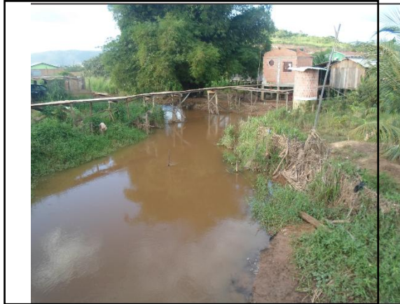
Figura 1: Ocupações irregulares na planície do rio Parauapebas, que resulta na modificação do comportamento da descarga e carga sólida do rio, devido à construção de casas, barracas, o desmatamento das margens e à práticas agrícolas podem modificar a carga de sedimentos que os rios transportam.

drenar essa quantidade de água aumentada, resultando assim no escoamento de águas pelas ruas e avenidas podendo gerar enxurradas, inundações relâmpagos, alagamentos e as enchentes de cursos d' água.