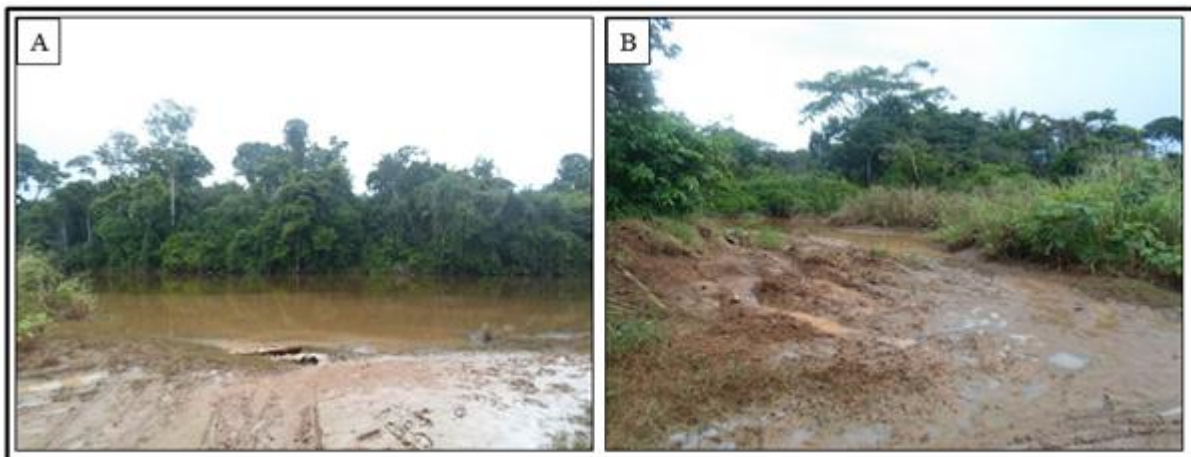
Figura 3: Em A: Rio Parauapebas com uma grande carga de sedimentos sendo depositada no seu leito. Em B: Grande quantidades de sedimentos carregados pelo Igarapé Ilha do Coco e depositados no rio Parauapebas.

As ocupações irregulares nas planícies de inundação, destruição da mata ciliar e derrocagem de morros de forma irregular, percebe-se uma forte modificação no comportamento da carga sólida do rio, onde os sedimentos carregados pela energia do rio estão sendo superiores ao que é normalmente exercido (Figura 3). Água da chuva que é infiltrada diretamente no solo ocasionando o aumento dos processos erosivos, permitindo um maior escoamento de partículas e sedimentos que causam a poluição e assoreiam o leito dos rios, fazendo com que os rios comecem a represar esta grande carga sedimentar que está sendo depositada em seu leito.